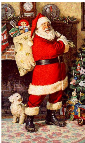
Santa má mnoho podob

Santa Klaus a Mikuláš je vlastně jedna a tatáž osoba. Santa Klaus vznikl chybou ve výslovnosti holandského slova Sinterklaas, které je zkratkou slova Sint Nicolaas neboli Svatý Mikuláš. Není tedy důvod ho do naší země zavádět, když už tu je :-).