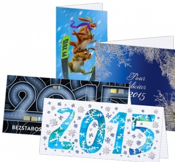
Ať se v novém roce daří!

Možná vás překvapí, že zkratka PF je čistě český fenomén, který nikde jinde (snad kromě Slovenska) nenajdete. Zkratka je odvozena z francouzského Pour feliciter - "pro štěstí". Zkratka PF je vynálezem hraběte Chotka z Chotkova a Vojnina.