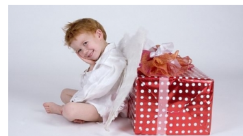
Na každého se dostane!

Pokud máte zmatek v tom, kdo vlastně nosí vánoční dárky, tak vězte, že je to ještě složitější, než by člověk čekal. Každopádně dopisy, které těmto stvořením děti každoročně píšou, k nim dorazí bez problémů :-).